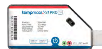
Principales especificaciones técnicas tempmate.®-S1 PRO TH