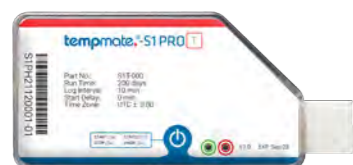
Principales especificaciones técnicas tempmate.®-S1 PRO T